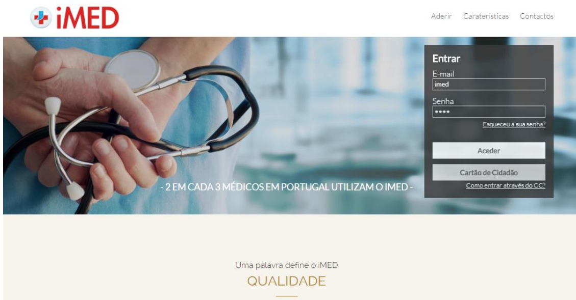
Figura 1- Acesso à plataforma.

Aceda ao portal www.imed.pt e clique em 'Aderir'.